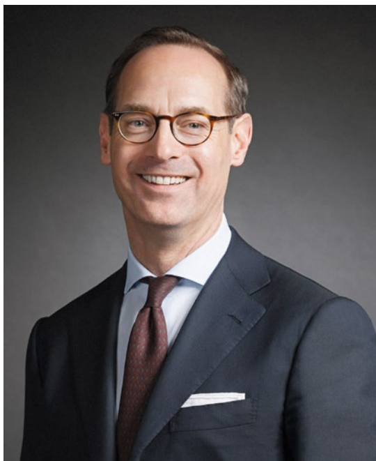
OLIVER BÄTE Vorsitzender des Vorstands